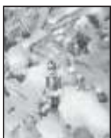
Titelbild: T. Poppe-Gildehaus